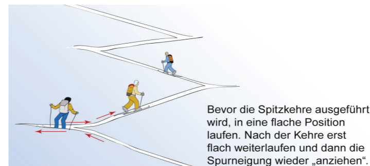
DSV-Lawinenserie, Teil IX: 3. Grafik – Bildunterschrift am Ende der Pressemeldung.

Es kommt vor, dass Passagen wie Senken und Mulden mit Fellen abgefahren werden.