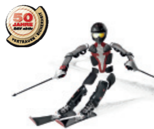
Optimaler Schutz für Wintersportler mit den DSV-Skiversicherungen! Mehr Informationen unter www.ski-online.de/DSVaktiv

Informationen und Bildmaterial zu diesem Thema auf dem DSV-Presseserver: Link: www.ski-online.de/presse – Zugang: presse/presse Zielpfad: DSV_Freizeitsport/02_Themenfelder/02_04_Sicherheit im .../02_04_06_DSV-Lawinenserie Zielpfad: DSV_Freizeitsport/03_Bilder/03_04_Sicherheit im Skisport/03_04_06_DSV-Lawinenserie