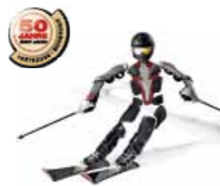
Optimaler Schutz für Wintersportler mit den DSV-Skiversicherungen! Mehr Informationen unter www.ski-online.de/DSVaktiv

Bei der Punktortung wird der Bereich, der durch die Feinsuche eingegrenzt wurde, systematisch sondiert. Während der Feinsuche wird meist wertvolle Zeit verschenkt, bei Versuchen, den genauen Liegepunkt mit dem LVS-Gerät zu ermitteln. Es ist effektiver, frühzeitig mit dem Sondieren zu beginnen. Beim Sondieren ist es empfehlenswert, mit Handschuhen zu arbeiten, weil sich die Sonde sonst durch die Körpertemperatur der Hand erwärmt und Schnee an der Lawinsonde „kleben“ bleibt. Die Sonde wird dabei im 90°-Winkel zur Schneeoberfläche eingestochen. Wenn Verschüttete geortet wurden, sollten man die Sonde als Bezugspunkt stecken lassen und mit dem Ausgraben beginnen.