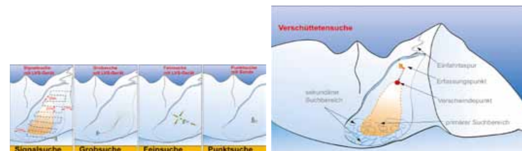
DSV-Lawinenserie, Teil XI: 1./2. Grafik – Bildunterschriften am Ende der Pressemeldung.

Passiert ein Lawinenabgang oberhalb des eigenen Standorts, gibt es nur eine Lösung: Versuchen, die Gefahrenzone so schnell wie möglich zu verlassen. Ein letzter Rettungsversuch kann darin bestehen, seitlich aus der Lawine herauszufahren, wenn man sich vorher nicht mehr in Sicherheit bringen konnte. Schafft man das nicht mehr, besteht allerdings die Gefahr, dass man sich nicht mehr von Ski und Stö-